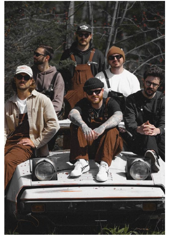
Le groupe Tcheu Misère du Nouveau-Brunswick sera l'un des groupes en vedette lors de la soirée «Les Winter Blues : un dégel mi-vernal» le 7 mars au théâtre The Mack, à Charlottetown.